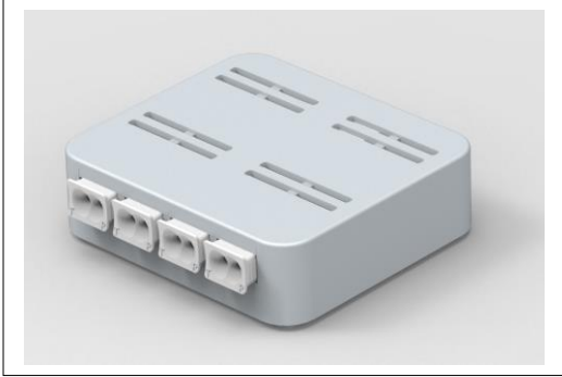
ACT4001 Imagen de producto