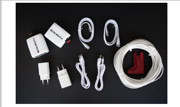
KIT SNAP DATA ACT1003 Contenido